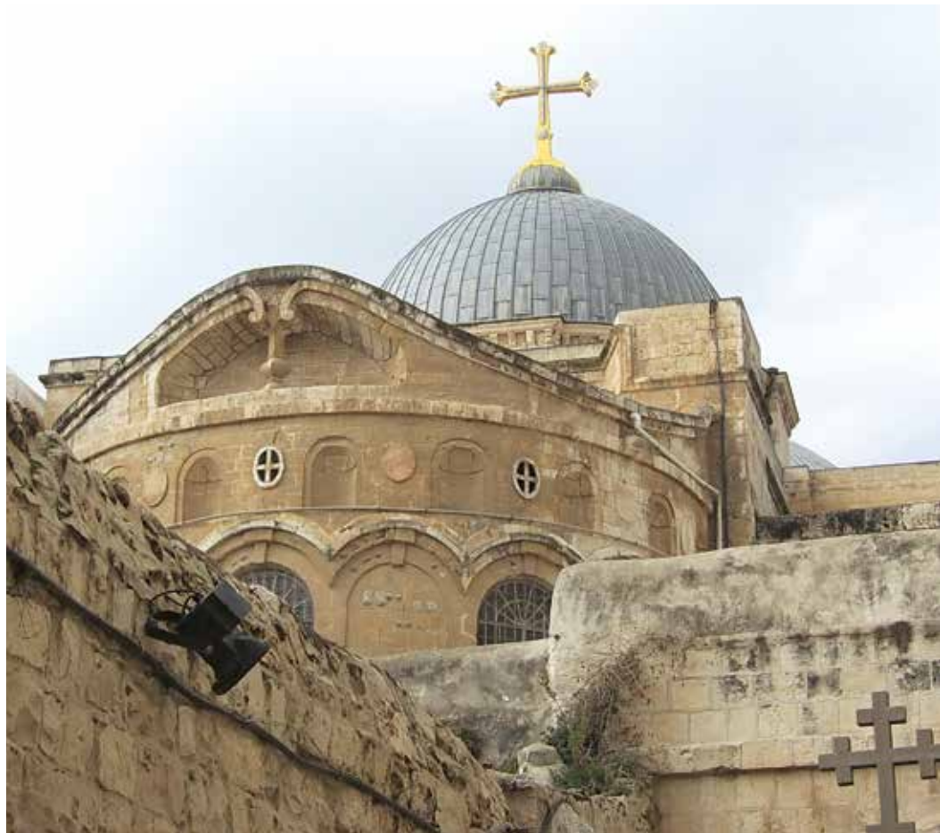
Die Grabkirche in Jerusalem – der Überlieferung nach ist dies die Stelle der Kreuzigung Jesu und seine letzte Ruhestätte.