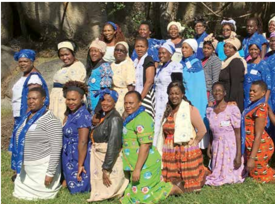
Diese Frauen haben sich an der Liturgie zum Weltgebetstag in Simbabwe beteiligt.