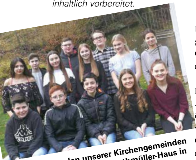
Die Konfirmanden unserer Kirchengemeinden hatten viel Spaß im Otto-Riethmüller-Haus in Weidenthal.

Auf der Konfirmandenfreizeit von Freitag, 24. bis Sonntag, 26. Januar haben die diesjährigen Konfirmanden das Thema „ordentlich miteinander Gottesdienst feiern“ als Konfirmationsthema ausgesucht und inhaltlich vorbereitet.